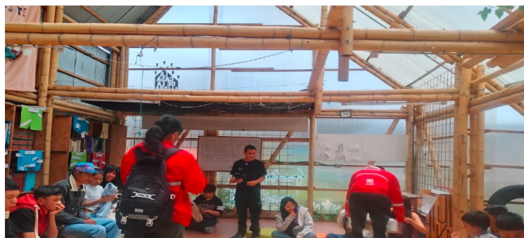
FOTO1: Jornada de integración y participación juvenil durante la actividad desarrollada en articulación interáreas en la localidad de San Cristóbal.