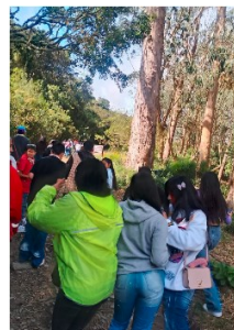
FOTO3: Registro fotográfico de la jornada realizada con participación activa de los asistentes en actividades de recorrido y acompañamiento territorial.