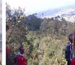
FOTO4: Participantes durante el recorrido pedagógico desarrollado en la Cantera del Zuque, en el marco de la Semana de la Juventud.