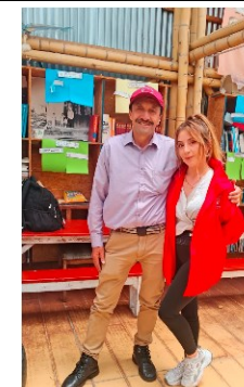
FOTO2: Espacio de aprendizaje y reconocimiento territorial con jóvenes participantes durante la salida pedagógica programada.